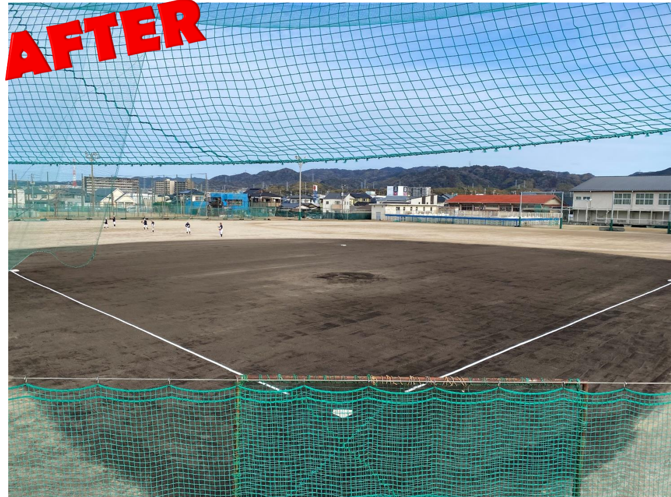
令和5年1月 完成した黒土のグラウンド