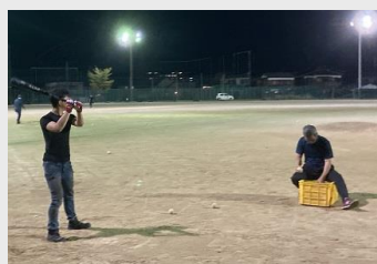
バッティング練習