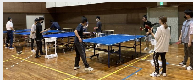
卓球部の全体練習