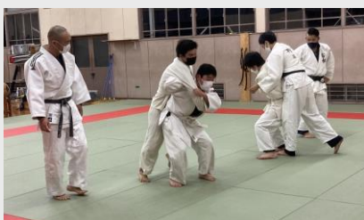
柔道部の全体練習