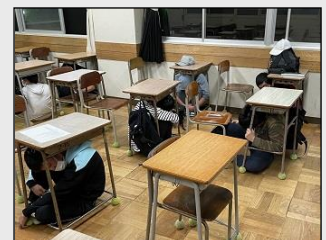
机の下に避難しています

地震とその後発生する津波を想定して行いました。本校は海拔2.7mです。決して安心はできません。防災訓練は「自助」活動の一つです。この訓練で得た経験や知識を忘れずに生かしてほしいと思います。