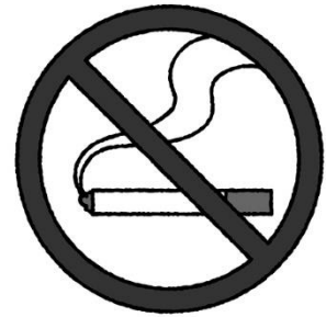
未成年の喫煙は法律でも禁止