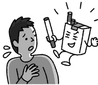
やめたくてもやめられなくなる 「依存症」になる危険性も