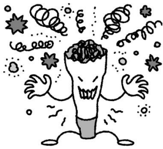
有害物質が多く体に悪影響