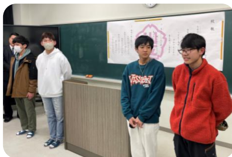
旧生徒会役員挨拶