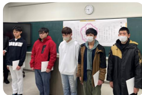
新生徒会役員挨拶