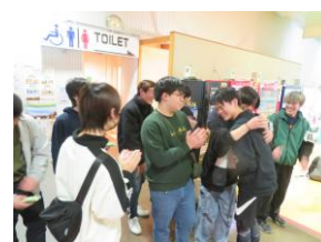
結果発表（2ゲームの合計）