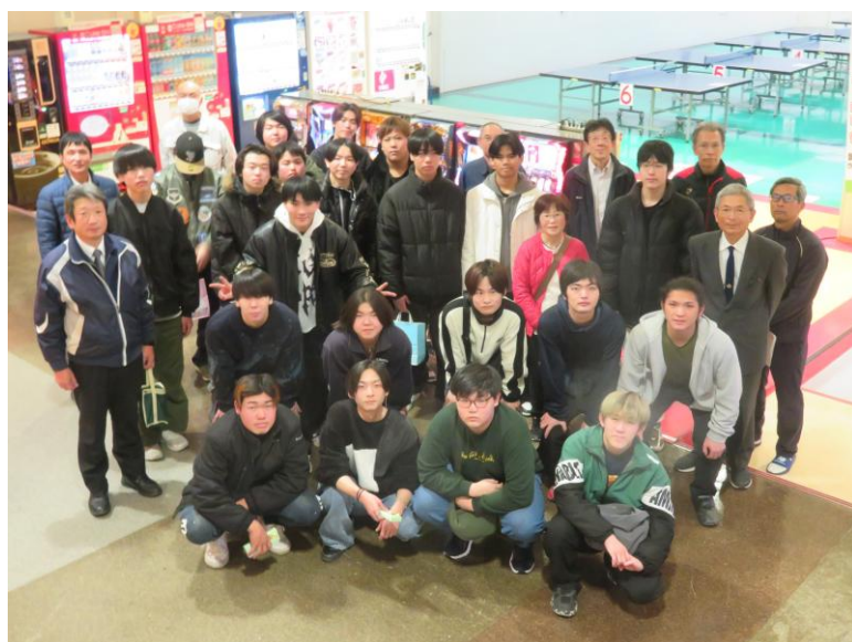
予餞会後の記念撮影